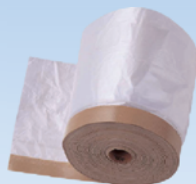
NTストロングマスキング