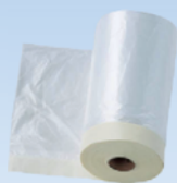
NTポリエチマスキング