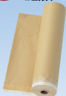
NTクラフトマスキング