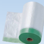
NTポリミドリマスキング